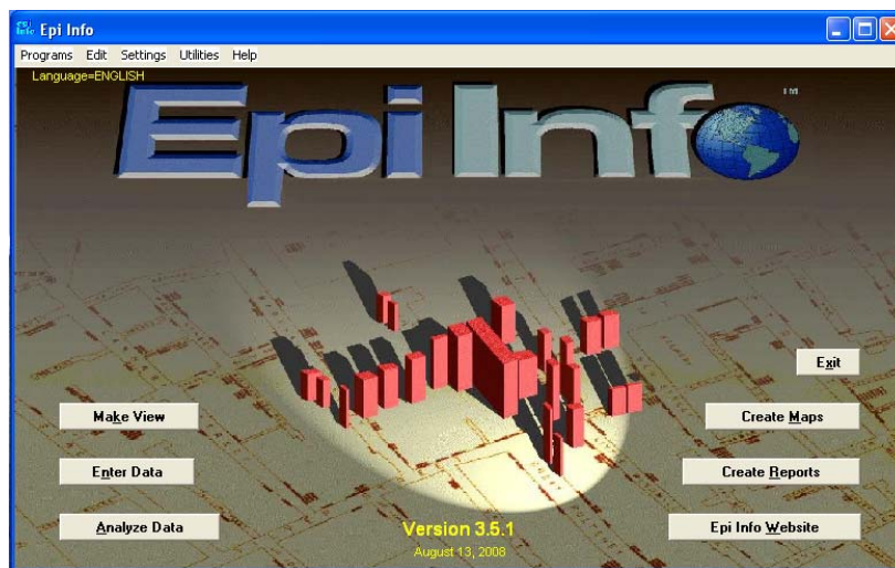
Figura 4 - Tela inicial do Epi Info

O Web Install é um módulo que facilita a instalação do Epi Info , para maiores informações clique na opção more info (ver Figura 3 ). Após baixar o arquivo da internet, execute-o (duplo clique) no diretório em que foi salvo, para instalá-lo.