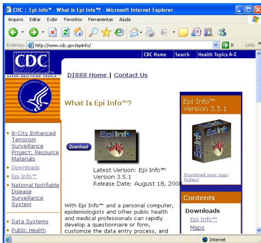
Figura 1 - Página na internet do Epi Info

Para instalação do programa é necessário entrar no endereço eletrônico do Epi Info no portal do CDC (clique no link ao lado).