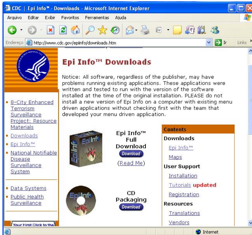
Figura 2 - Página de downloads do Epi Info

Para instalação do programa, é recomendável escolher a opção Web Install, conforme Figura 3.